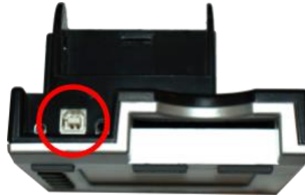
PM3 & PM4