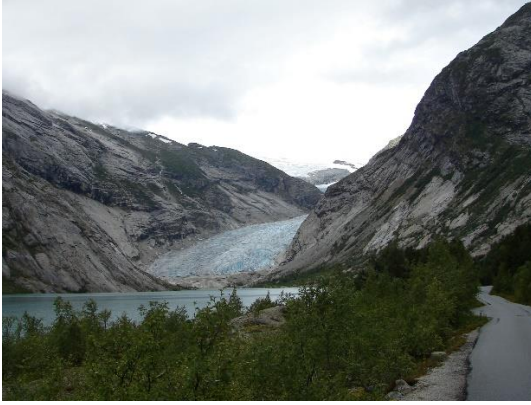
Im Jahr 2009 reichte das Eis noch fast bis zum Gletschersee