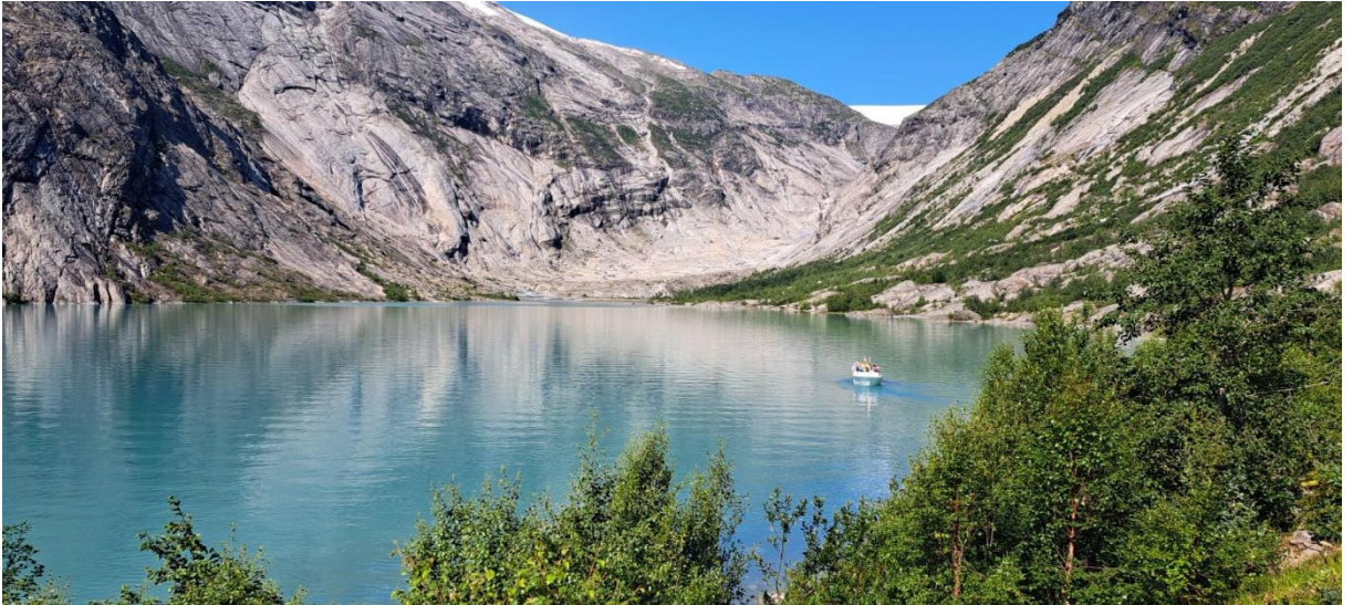
Im Jahr 2024 hat sich der Gletscher so weit zurückgezogen, dass von dieser Stelle aus kein Eis mehr zu sehen ist.