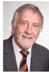
Winfried Röcker Präsident des DMYV

Herzliche Einladung zur Pilgerreise nach Magdeburg! Im Rahmen des Kirchentages auf dem Weg in Magdeburg, vom 25. bis 28. Mai 2017, findet ein großes Boots- und Schiffstreffen in der berühmten Stadt an der Elbe statt. Kommen Sie mit dem eigenen Kanu, Ruder- oder Motorboot und genießen Sie ein Ereignis der besonderen Art mit vielen Veranstaltungen zu interessanten Themen in geschichtsträchtiger Umgebung!