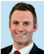
Ole Bischof Vizepräsident Leistungssport Deutscher Olympischer Sportbund