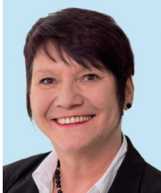
Elvira Menzer-Haasis Präsidentin Landessportverband Baden-Württemberg