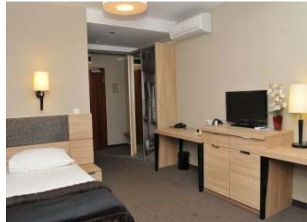
IV) Hotel**** in Elbląg,