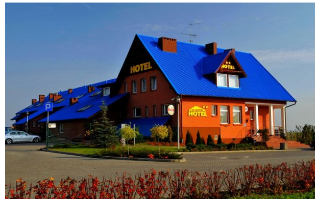
II) Hotel** in Gniew,