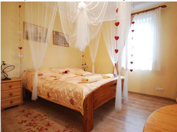
V - VII) Hotel*** neben Miłomłyn,