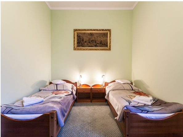
III) Hotel*** in Marienburg,