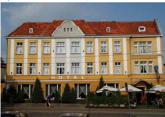
III) Hotel** in Chełmno,