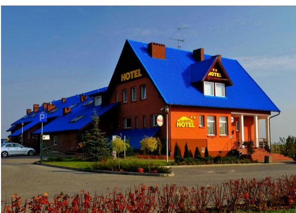
V) Hotel** in Gniew,