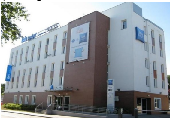
I) IbisBudget in Toruń