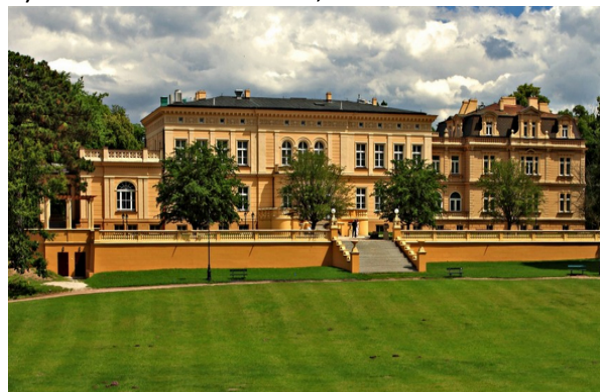
II) Palast in Ostromecko,