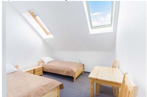
IV) Marina in Grudziądz,