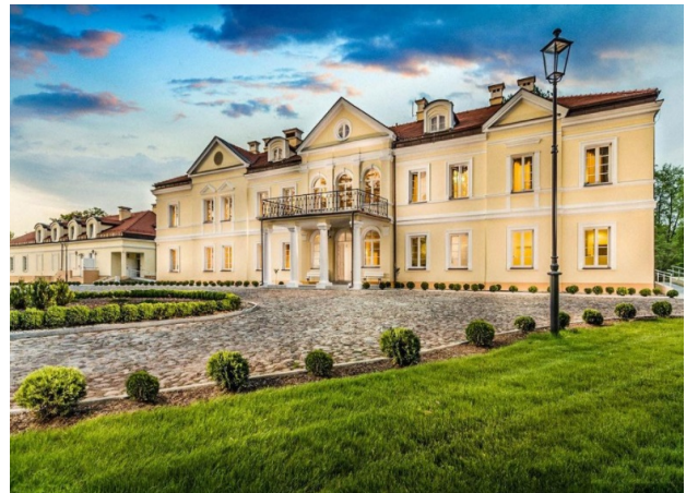
VI und VII) Hotel *** in Sobienie Szlacheckie,