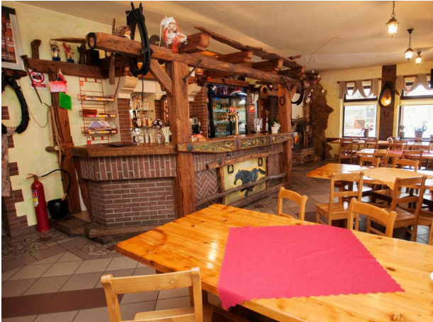
V) Gasthof in der Nähe von Kozenice,