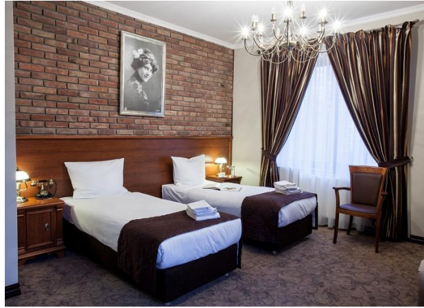
IV) Hotel *** in Pulawy,