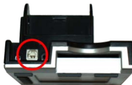
PM3 & PM4

Die benötigten USB A-B 2.0 Kabel werden mit der „B-Seite“ ins Ergometer gesteckt (siehe Abbildung links).